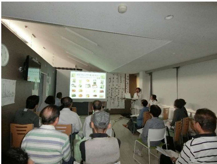
(栄養士の講演の様子)