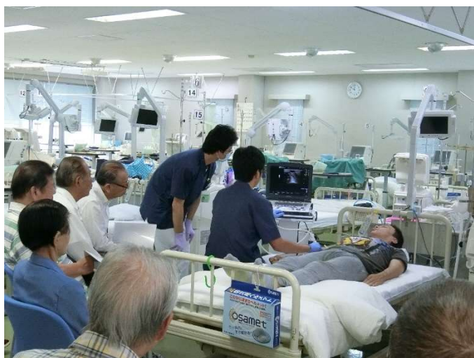
(エコー検査実演の様子)

最初に技士課から超音波診断装置(以下 エコー)とシャント管理について講演した後、実際に患者様にモデルになっていただきエコーを実演しました。